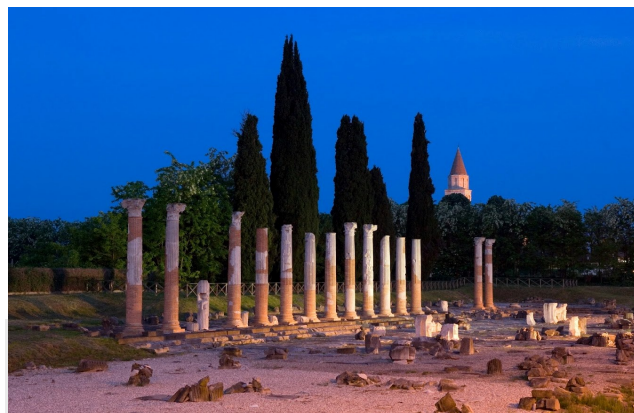
Foro romano - Aquileia

La Basilica di Aquileia, dedicata alla Vergine e ai santi Ermacora e Fortunato, ha una storia architettonica le cui radici affondano negli anni immediatamente successivi al 313 d.C. Il pavimento è il più esteso mosaico paleocristiano del mondo occidentale (ben 760 m 2 ): basterebbe esso solo a ripagare il pellegrino del lungo viaggio per venire a visitare l'Ecclesia Mater, patrimonio dell'umanità.